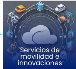
Servicios de movilidad e innovaciones