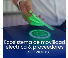
Ecosistema de movilidad eléctrica & proveedores de servicios