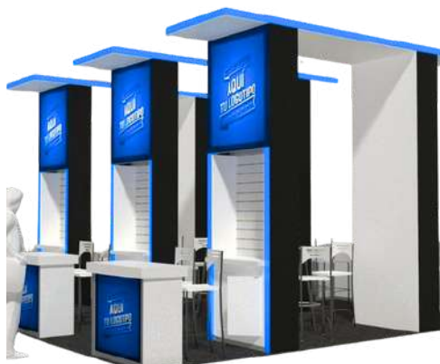
*imagen de referencia, Pabellón Startups

Incluye gafete de expositor (3 por cada 9 m 2 ) y mención en el directorio. NO incluye construcción, mobiliario o servicios.