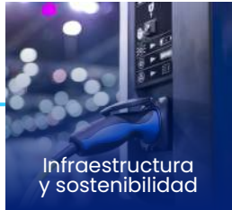
Infraestructura y sostenibilidad