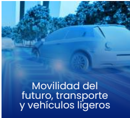
Movilidad del futuro, transporte y vehículos ligeros